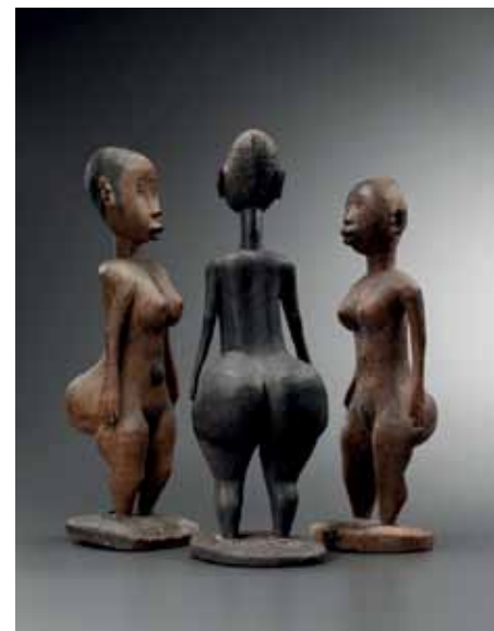
Trois statuette de Vénus, Makondé, Mozambique.