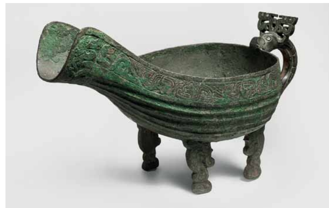
Aiguière rituelle, dynastie Zhou, Chine, 800-700 av. J.-C., L. 37 cm, bronze.

Ces peintures aussi me faisaient entrer en contact avec les statues primitives d’Afrique et d’Asie qui ont inspiré des artistes modernes comme Pablo Picasso ou Paul Gauguin. Un beau jour, ma passion des objets l’a emporté sur celle de la peinture », explique-t-il. « Il y a un an et demi, j’ai ouvert ma toute première galerie à Bruxelles. Comme elle est centrée principalement sur l’art africain, j’ai plus de marge qu’à Paris pour innover avec des pièces souvent moins connues d’Asie du Sud-Est et d’Océanie. En outre, j’associe des pièces archéologiques avec des objets primitifs. Mes principaux critères de sélection sont qu’ils n’ont pas subi d’influence externe et qu’ils sont utilisés dans les villages, souvent dans un contexte rituel ou sacré, comme décoration du corps pour exprimer la force ou le prestige. »